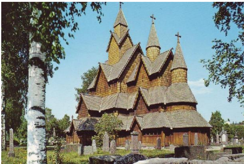
Heddal staafkerk in Telemark