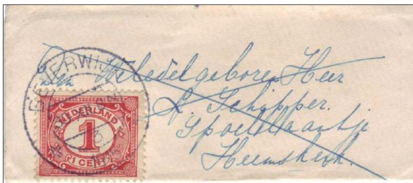
Visitekaartje van Beverwijk naar Heemskerk, 30 december 1915.

Nieuwjaars-correspondentie. Ten einde de bestelling van nieuwjaarsbrieven, briefkaarten en nieuwjaarskaarten op 1 Januari te besporenden, kunnen die van af heden op de post worden bezorgd. Om bestelling op 1 Januari te doen plaats hebben, moeten die brieven en kaarten van een kruis op het adres worden voorzien. Op de bestelling dier stukken op 1 Januari, althans voor zoo veel zij bestemd zijn voor groote plaatsen, mag echter niet worden gerekend. PURMEREND, 27 December 1890. De Directeur van het Postkantoor, P. F. FREUDENBERG.