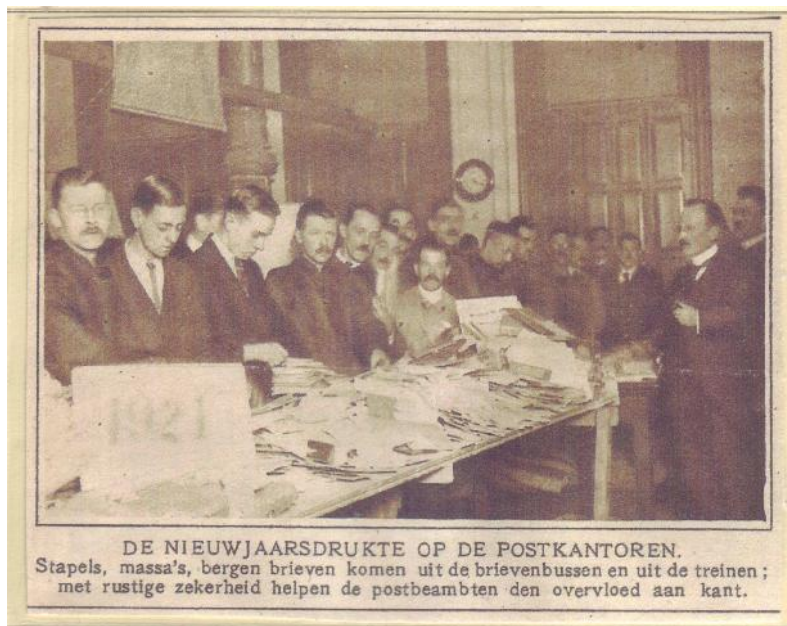
DE NIEUWJAARSDRUKTE OP DE POSTKANTOREN. Stapels, massa's, bergen brieven komen uit de brievenbussen en uit de treinen ; met rustige zekerheid helpen de postbeambten den overvloed aan kant.