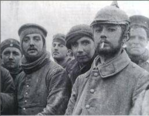
Verbroedering tussen Britse en Duitse soldaten bij Ploegsteert (België).

De volgende dag, op Eerste Kerstdag, kwamen aan beide kanten van het front de soldaten hun loopgraven uit. In het volle zicht van de vijand werden velddiensten gehouden zonder dat er een schot werd gelost. Beide partijen zwaaiden naar elkaar en enkele moedige soldaten liepen het niemandsland in om elkaar te begroeten. Aanvankelijk vormden zich kleine groepjes, vervolgens steeds grotere, totdat op sommige plekken honderden soldaten bij elkaar stonden. Er werden handen geschut, men bood elkaar een vuurtje aan en wisselde geschenken uit: sigaretten, Duitse worsten en sigaren, ingeblikte hutspot, tabak, familiefoto's en Londense kranten.