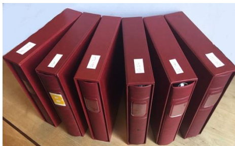
▲ Kavel 7, oude penning uit 1839 en kavel 181 ►