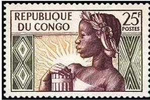
De eerste vier zegels (1959) van Congo-Brazzaville,

de rivier zich ook, al zetten die er nog de aanduiding Democratique bij. De van oorsprong Franse République du Congo werd in maart 1970 de République Populaire du Congo, maar in 1991 werd het weer République du Congo. Overigens moet je wel een gedreven filatelist zijn om de plaatjes uit die periode te willen verzamelen.