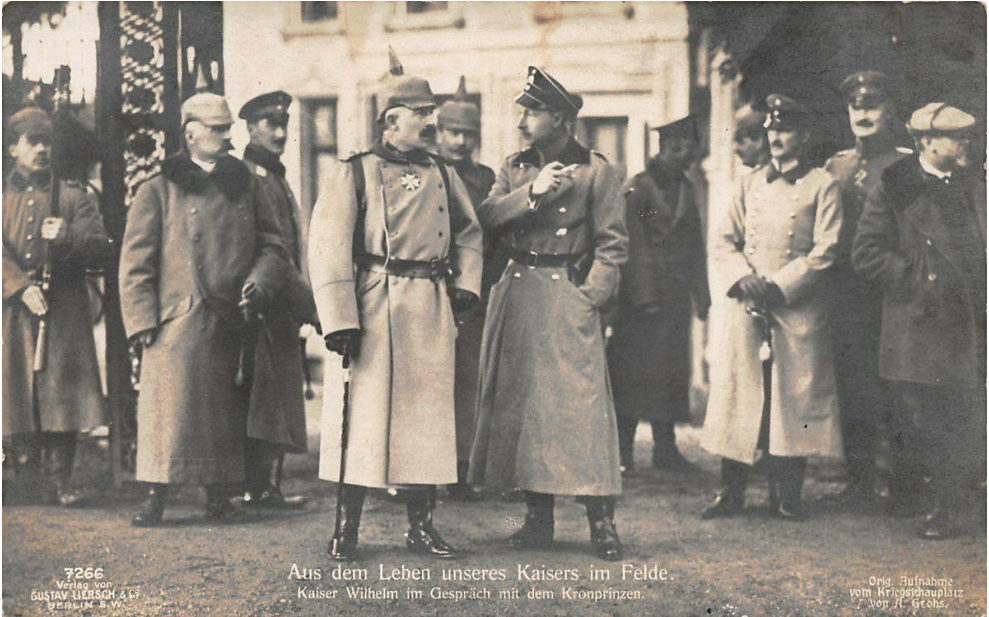
De Duitse keizer en zijn zoon, omringd door officieren

Een reactie op zijn aanbod heb ik helaas niet kunnen vinden, misschien is die er nooit gekomen, misschien heeft men de man tegen zichzelf in bescherming genomen, maar zeker is dat er van zijn voornemen nooit iets is terechtgekomen.