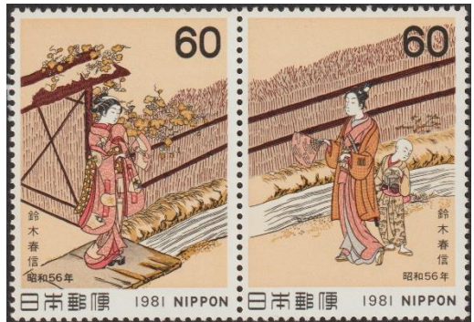
'Maanbloem' ( se-tenant paar) uitgegeven voor de week van de filatelie in 1981.

Andere ontwerpen van Harunobu die in Japan op postzegels zijn verschenen zijn: 'Twee vrouwen lezen een brief' verscheen in 1969 ter gelegenheid van het 16e Congres van de Wereldpostunie. Dezelfde houtsnede, maar nu in de waarde van 84 yen, verscheen op een velletje met meerdere houtsneden van andere artiesten, in 2021 uitgegeven ter gelegenheid van de internationale postzegeltentoonstelling Philanippon 2021.